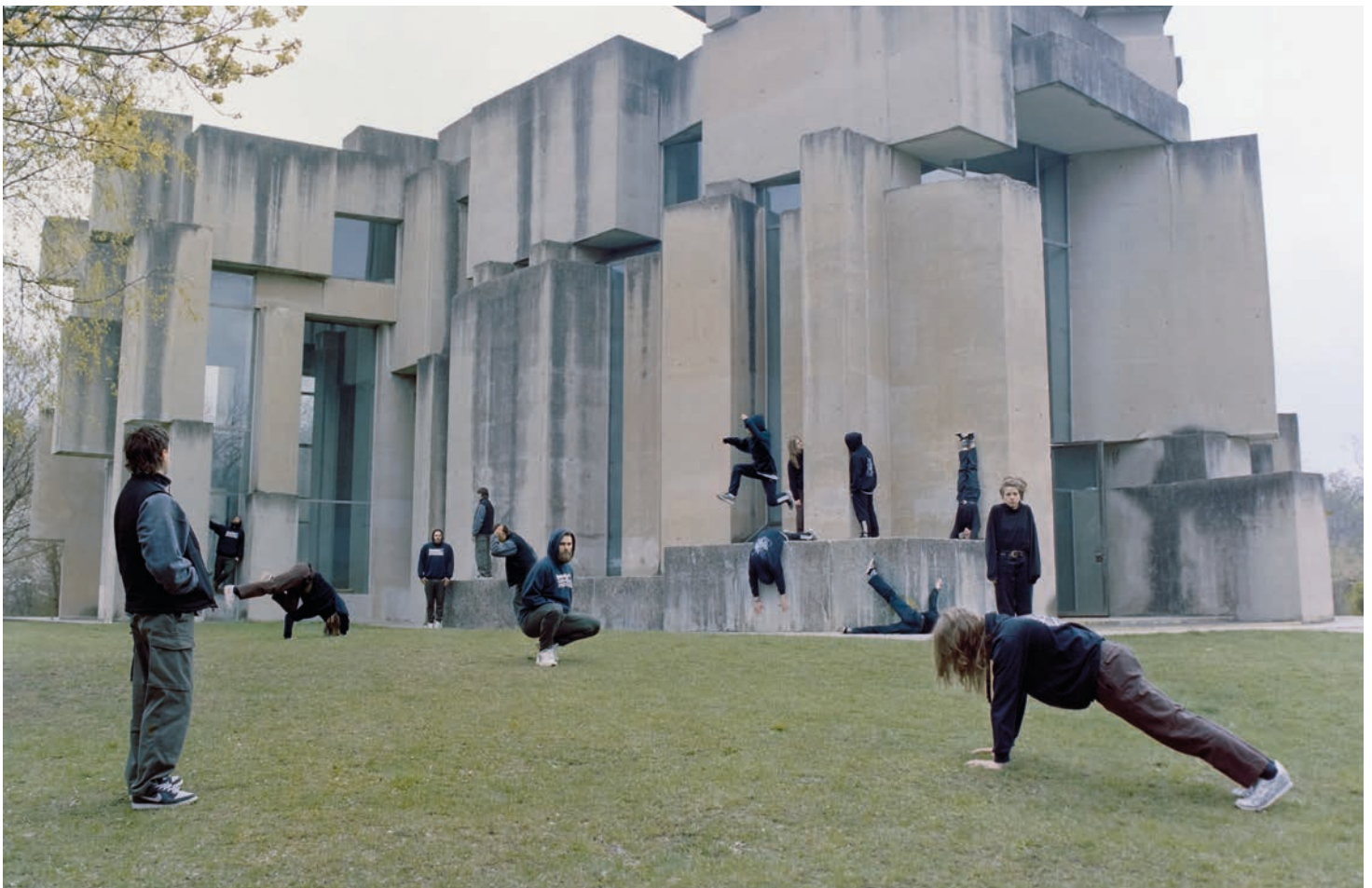
Wotrubas Kirche: als Handsigns-Choreografie im Stück zu sehen