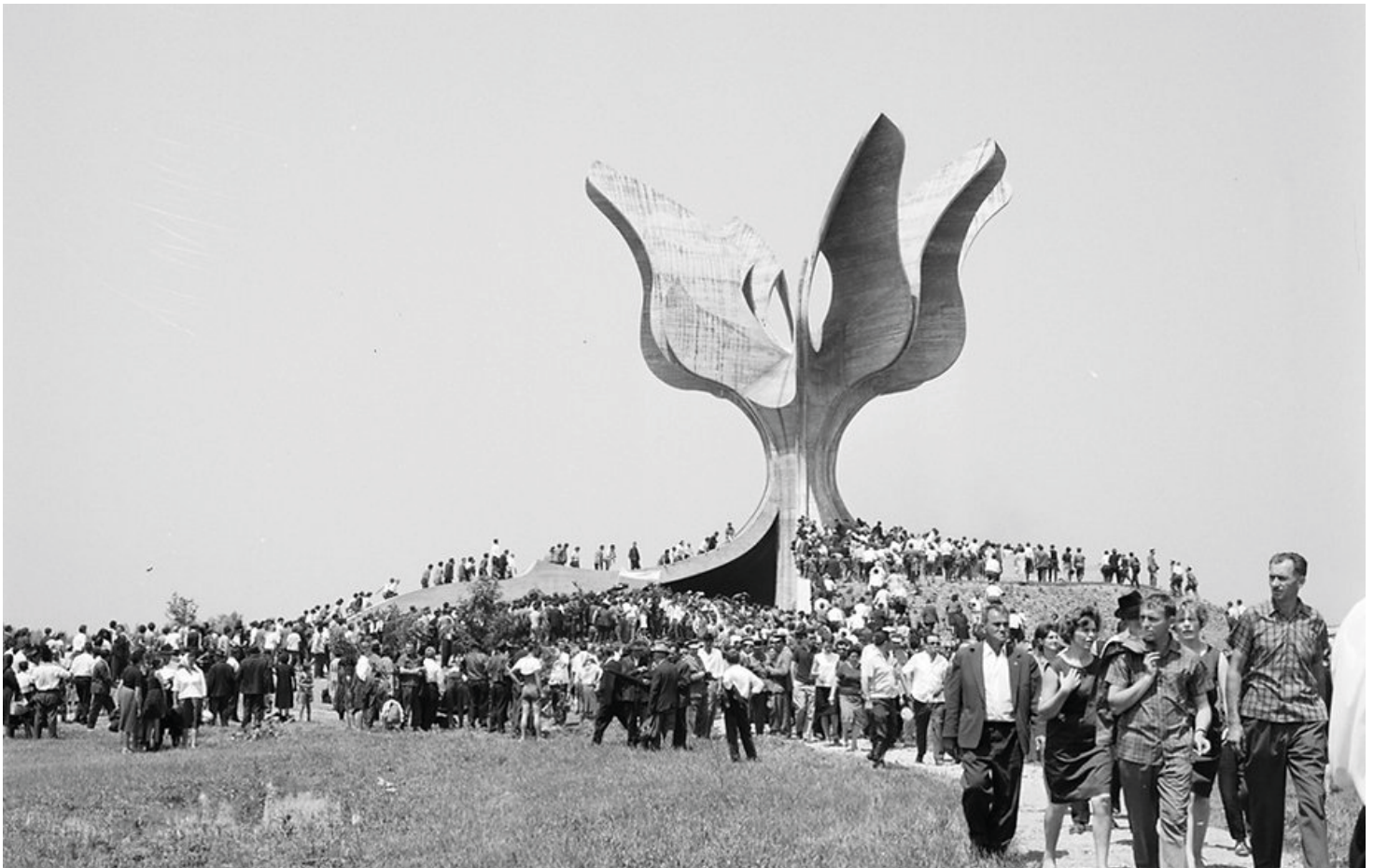
Jasenovac Monument – als Handsigns-Choreografie im Stück zu sehen © Jasenovac – The grand opening ceremony, July 1966 Quelle: www.spomenikdatabase.org