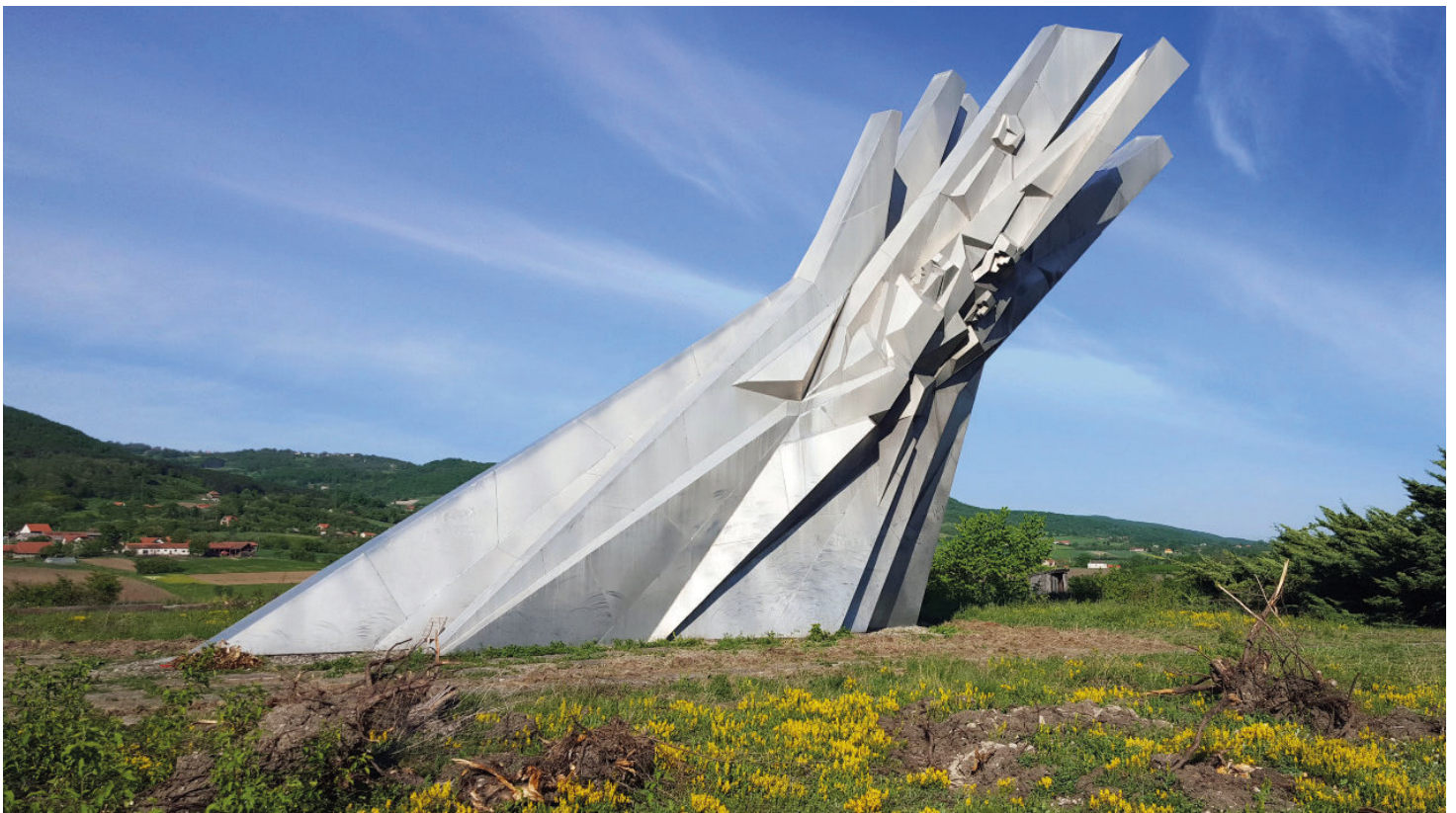
Ostra Monument – als Handsigns-Choreografie im Stück zu sehen und zu hören